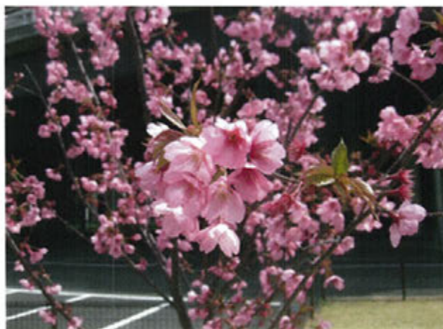
( 3月末、地震にも負けず見事に咲いたヨコハマ緋サクラ )