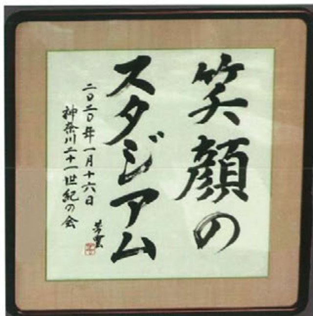
毎日新聞社神奈川イメージアップ大賞 副賞の色紙