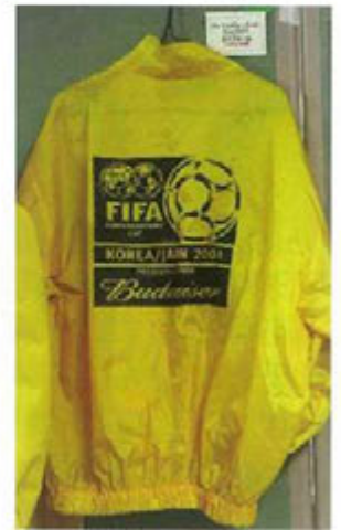
コンフェデレーションカップ 2001 ユニフォーム