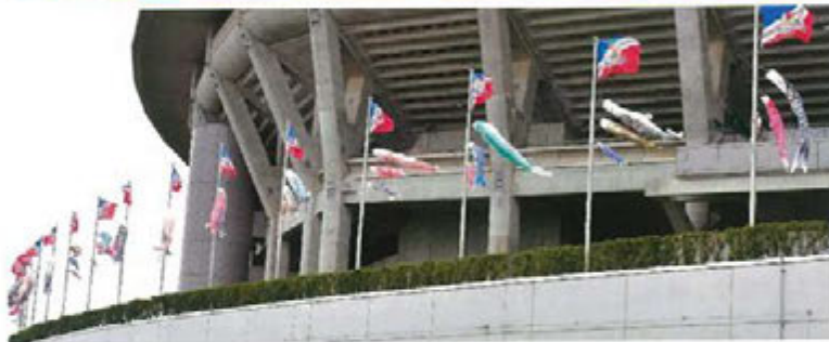
日産スタジアムに鯉のぼりが泳ぎます (2019年5月)