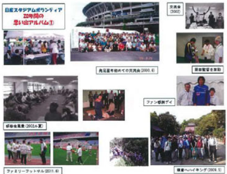
20周年の思い出アルバム(一部抜粋)