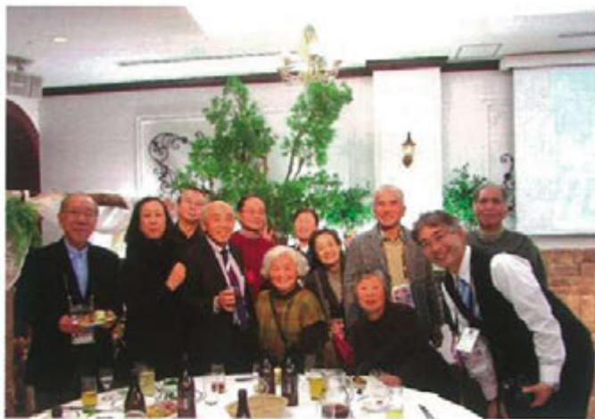
横浜マリノス(株)黒澤社長(中央)と記念撮影