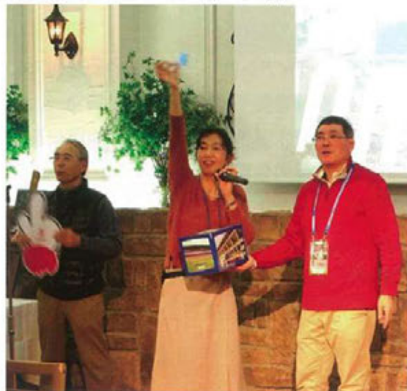
楽しい抽選会を計画・運営した実行委員の皆さん