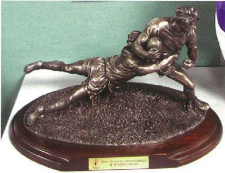
ラグビーワールドカップ2019大会開催の記念像