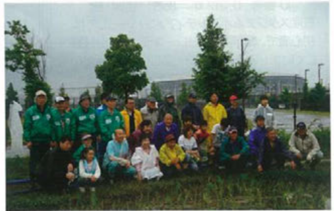
田植え(2012年6月)グリーン&クリーン部会主催