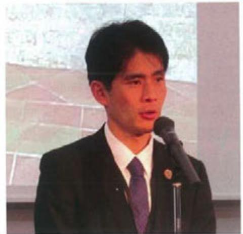
高橋事業部長からご挨拶がありました