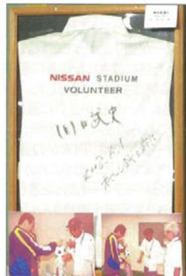
岡田武史横浜F・マリノス監督(当時)のサイン