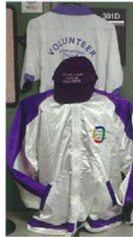
ボランティア創立 当時のユニフォーム