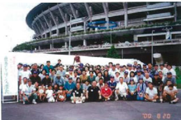
発足翌年の第1回交流会(2000年8月)