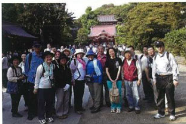
鎌倉でハイキング(2009年5月)イベント部会主催