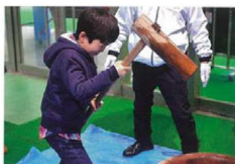
餅つき&しめ縄飾りづくり(2018年12月) 日産スタ ジアム・イベント部会・グリーン&クリーン部会共催