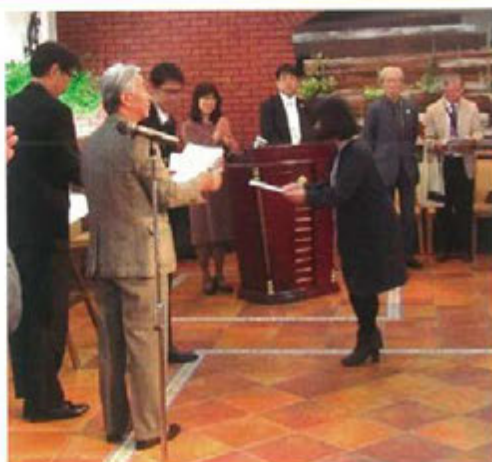
20周年感謝状授与式の様子