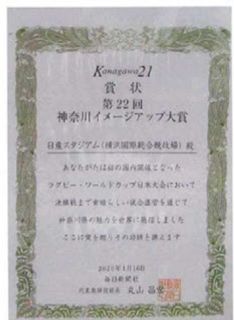
毎日新聞社神奈川イメージアップ大賞 賞状