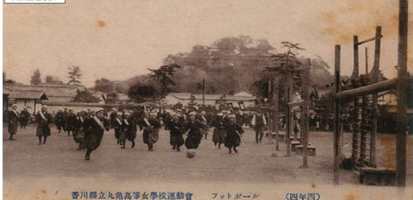
香川県立丸亀高等女学校運動会 フットボール (四年四)

1921年頃、香川県立丸亀高等女学校運動会の絵はがきの写真 ～ 袴を履いてサッカーを楽しむ女学生たち ～