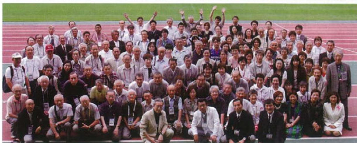
懐かしい10周年記念パーティーの集合写真、貴方の「いい笑顔」を見つけましょう！（スタジアム内で撮影）