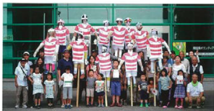
かかし作り(2018年8月)グリーン&クリーン部会主催 ラグビーワールドカップの日本代表チームかかし