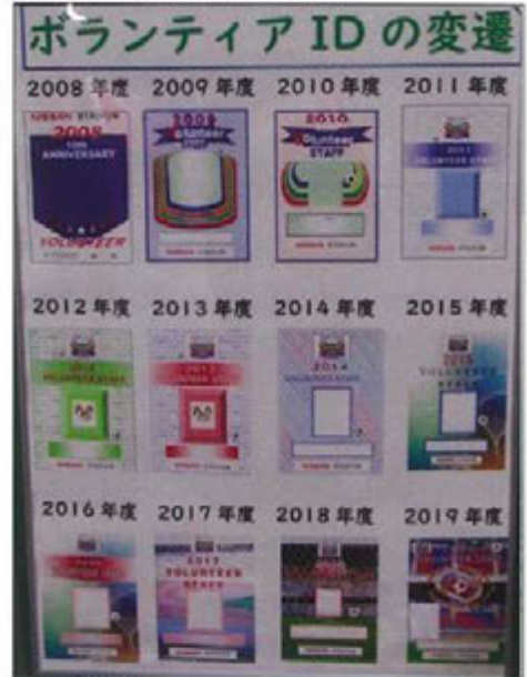
ボランティアIDの変遷