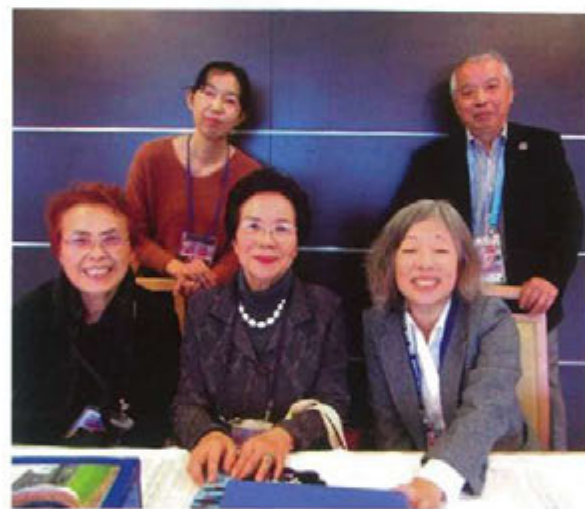
受付や会計を担当した実行委員の方々