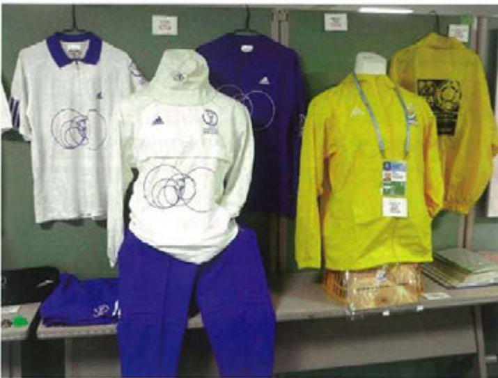
2002FIFA ワールドカップのユニフォーム(左) トヨタカップ2008ユニフォーム(右)